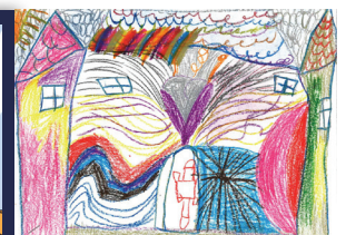
CHENNOUFI Lyana - 5 ans